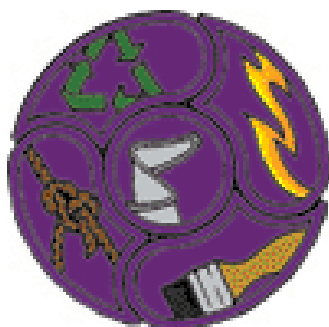
Tarpojen Tarppomerkki www.partio.fi

A A E K M M V A R T I O B K R W F S E Ä M L I T C E Q M H U E N J V L P D L S R P D A B L R I M E A Ö U I E N E T H I A F N Y O J N V U X S C J G Ä L I P P U K U N T A H M I R S E J A N T S V Ö A J Ä I N F A E P O A E J A S U T A R P O J A K A B F N U X V T S M L