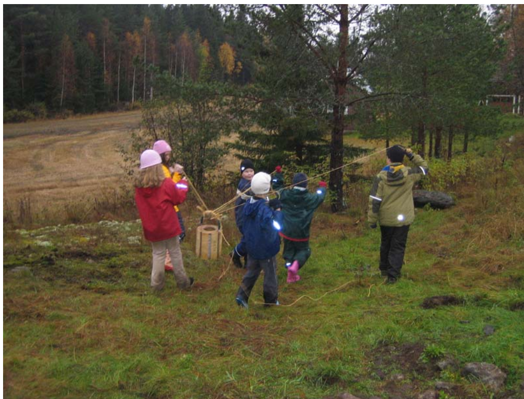
Seikkailurastilla tehtävänä oli pelastaa ”mehiläiskenno” karhulle

Suurin osa rasteista oli ulkona, mutta pieni syksyinen sade ei innokkaita partiolaisia haitannut. Lipunlaskun jälkeen kotiin lähti tyytyväinen, joskin päivän touhuista väsynyt joukko. Mukana oli sudenpentuja kaikista lippukuntamme laumoista, eli Delfineistä, Liekeistä ja Haukoista.