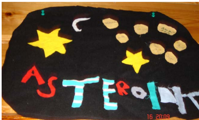
Kuvassa Asteroidien viiri