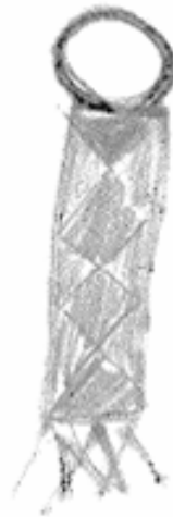
2. Avaimenperä ystävydensolmuista. Venla Kähkönen