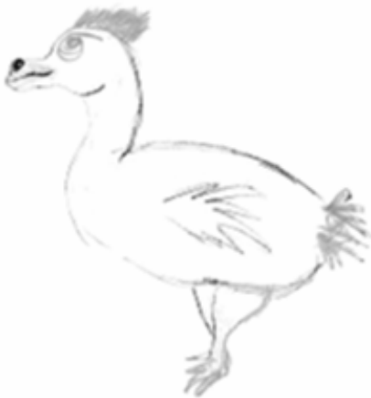
1. Sinisorsa. Riina Puonti